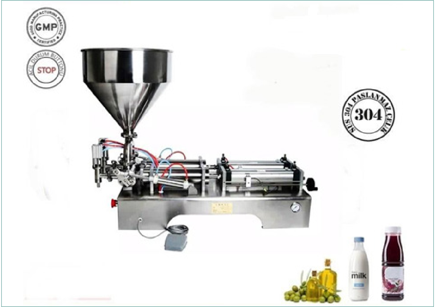
Şekil 3. Masere edilmiş kantaron yağları için yarı otomatik dolum makinesi

( https://www.renasmakina.com/ryd-vt150-yari-otomatik-dolum-makinesi )