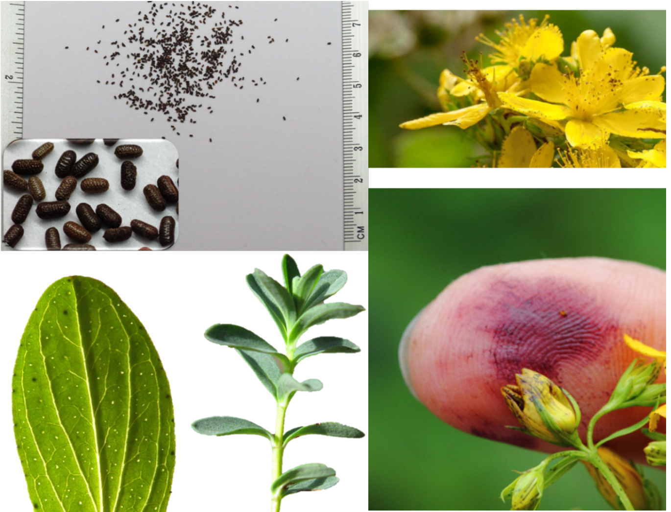
Şekil 2. Kantaron ( Hypericum perforatum ) bitkisi

( https://wikifarmer.com/hypericum-perforatum-st-johns-wort-seeds/ )